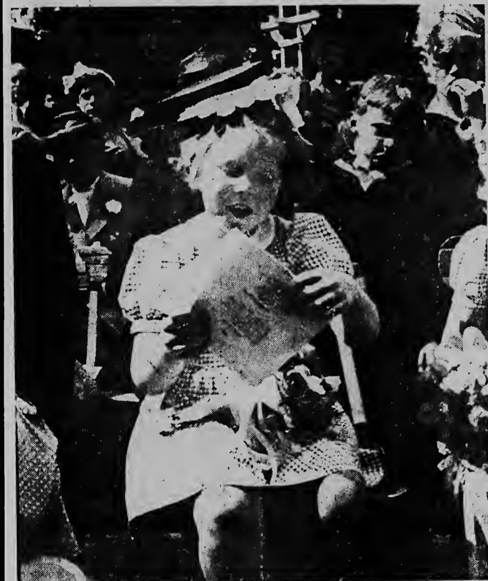
Durante di cumpleaños di Prins Bernhard na 1946 un fiesta di hardin grandi a se teni na Bonaire na su honor. Ribá e portret nos por welta prinses Beatrix, coe tin ocho anjo bieuw, y coe ta divertiendo su bini.